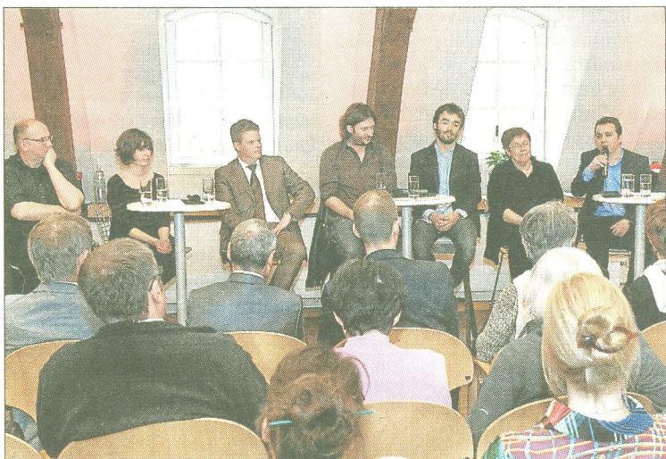
Le rôle primordial de l'école a été souligné.

En définitive, ce débat, bien qu'il laissât en suspens nombre de questions, eut le mérite d'ouvrir des portes par la convergence de réflexions diverses et ainsi de raviver la flamme pour la chose écrite.